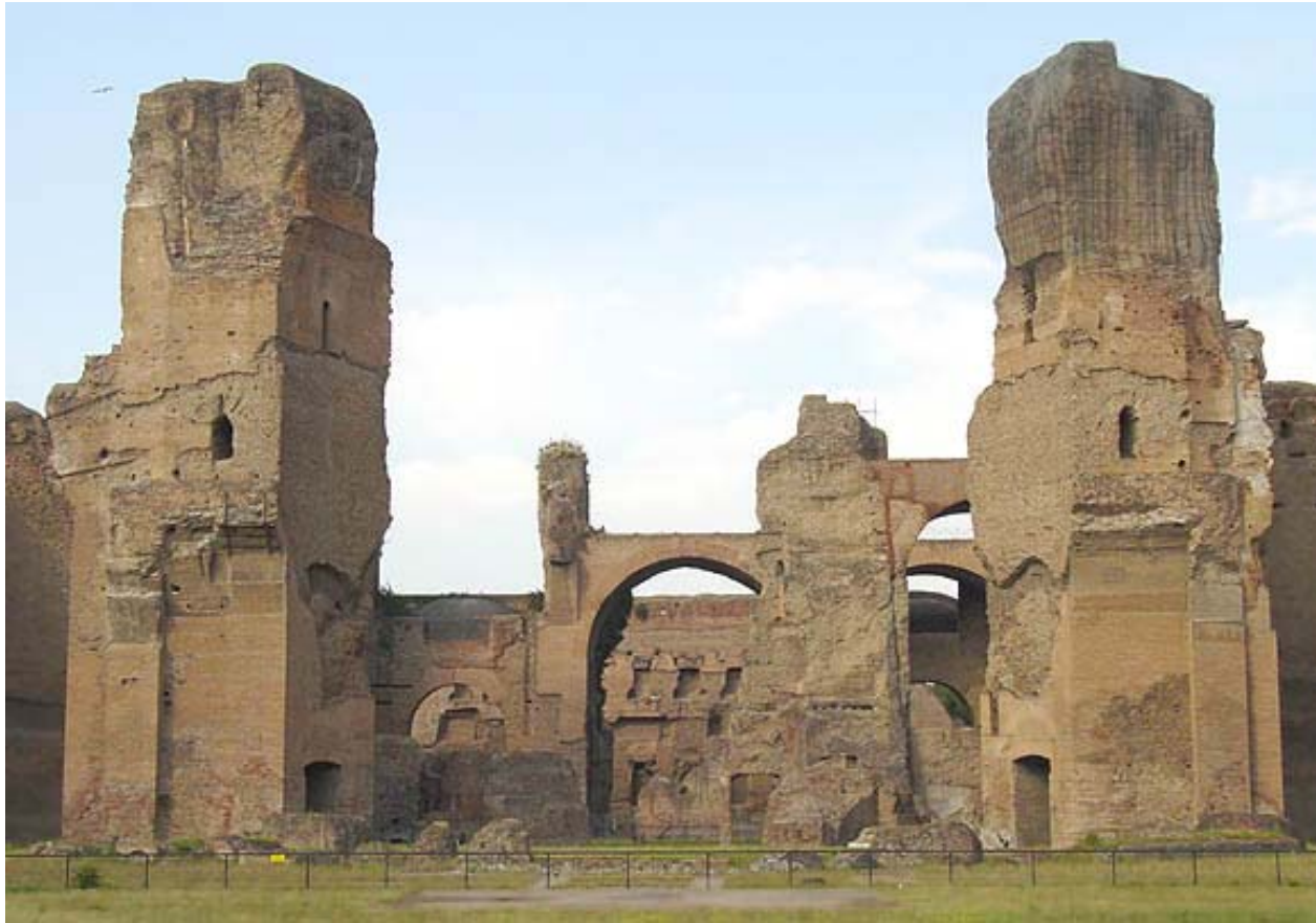
Baths of Caracalla